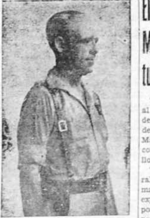
El general don Carlos Asensio, nombrado Alto Comisario de España en Marruecos

En fin, Hong-Kong ha sido llamada la ciudadela europea en Oriente. Su comunicación con el interior va a ser cortada por el Japón, "a pesar de todo". La cosa no es para mirarla con indiferencia.