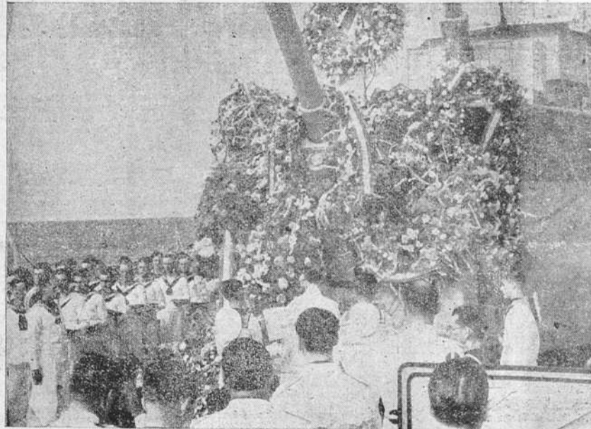
Misa de campaña celebrada a bordo del minador "Júpiter" en sufragio de los 500 asesinados en Cartagena.