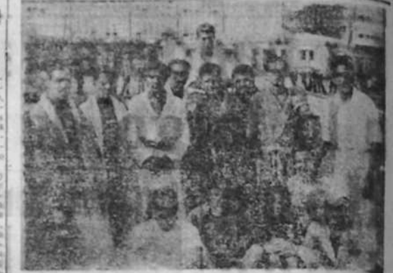
Participantes en las pruebas de natación organizadas por el SEU...