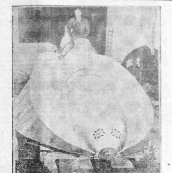
El famoso corredor Sir Malcolm Campbell acaba de presentar su canoa ultrarrápida "Pájaro Azul II", nuevo bólido dotado de un motor de 1.750 caballos, con el cual el célebre capitán ha batido el "record" mundial sobre el agua

LONDRES, 19. —El famoso corredor motorista Sir Malcolm Campbell ha vuelto hoy a batir el "record" mundial sobre el agua.