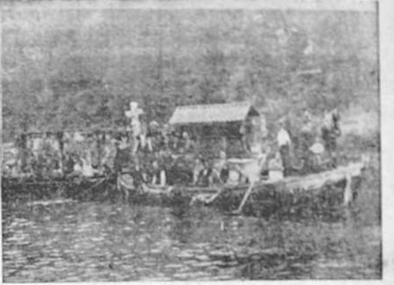
Una barca que llamó la atención. No le faltaba ni el hierro, ni el acero, ni un plantel de preciosas gallegas vestidas con el típico traje.

Es hallada la Corona imperial de la Virgen del Sagrario de Toledo