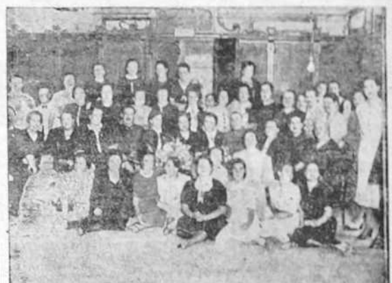
Señoras y señoritas del taller de Mujeres al Servicio de España que se reunieron para conmemorar el III aniversario de la fundación de la benemérita entidad.