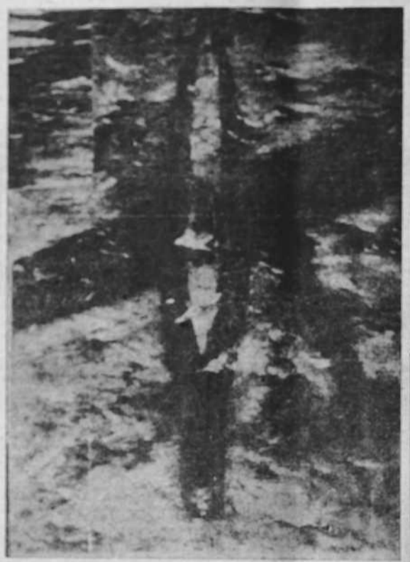
Un avión que patrullaba en el Mar del Norte, descubre un submarino alemán que, como puede apreciarse en el grabado, se transparenta admirablemente bajo las aguas