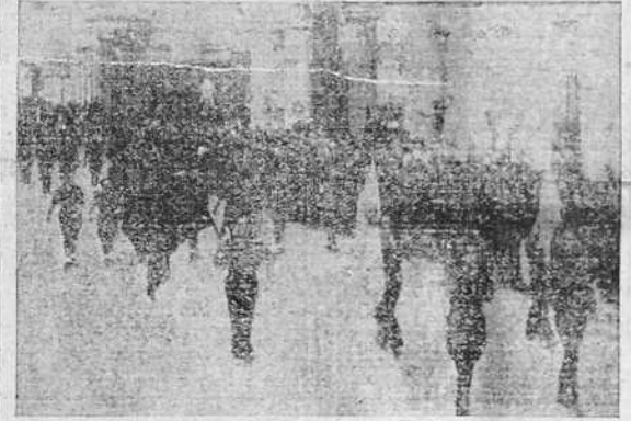
Diversos aspectos de los actos celebrados ayer en La Coruña en memoria de José Antonio Primo de Rivera.—Arriba: El Jefe provincial accidental del Movimiento leyendo la Oración de los Caídos y la lista de los que dieron sus vidas por Dios y por España, mientras el público escucha, ateniendo brazo en alto.—En el medio: La Sección Femenina saluda la Oración y la lista de los mártires.—Abajo: Desfile de la O. J. después del funeral celebrado en Santa Lucía.