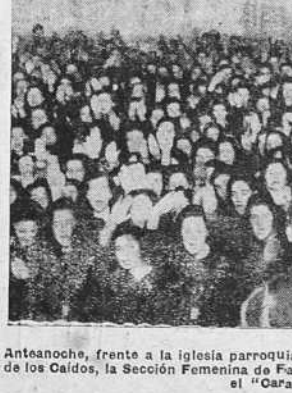
Anteaocho, frente a la Iglesia parroquial de Sta. Lucía, después de la Oración de los Caidos, la Sección Femenina de Falange Española Tradicionalista entono el "Cara al Sol". (Foto EL IDEAL GALLEGO).

Se negó a hablar del pacto de las nuevas potencias. La cuestión de China hallará su base de solución