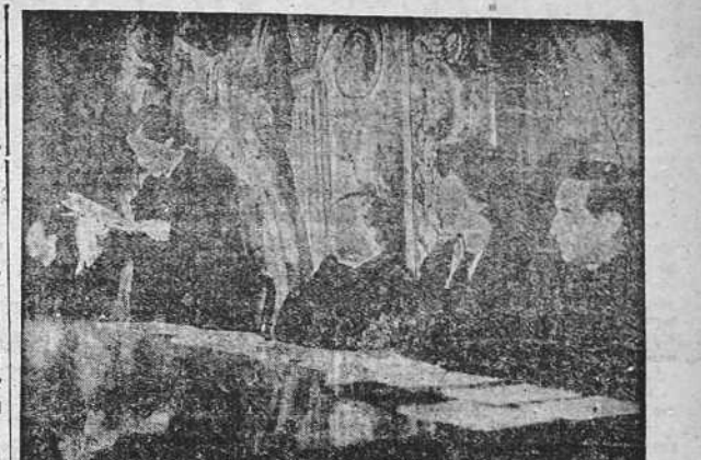
MADRID.—Seiscientas mil mujeres están representadas en el IV Congreso de la Sección Femenina de Falange Española Tradicionalista y de las JONS...

HELSINKI, 12.—Parte de guerra finlandés: "La noche del día 11 y las primeras horas del día 12 han sido bastante tranquilas..."