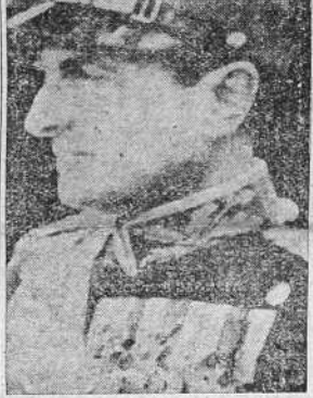
El Príncipe Pablo, Regente de Yugoslavia, en cuyo país se está celebrando la Conferencia balcánica

BELGRADO, 2.—El radio de esta capital ha anunciado esta noche, que no se dará ningún comunicado acerca de las sesiones de la conferencia de la Entente balcánica hasta el domingo próximo.—(EFE).