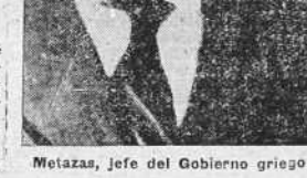
Metaxas, jefe del Gobierno griego

BELGRADO, 2.—El primer acuerdo de la Entente ha sido decidir seguir manteniendo la estrecha colaboración entre los cuatro países, según anuncian los medios bien informados. El acuerdo declara que si ningún Estado perteneciente a la Entente notifica su deseo de abandonarla con un