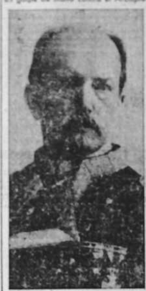
Luis Cadarso, comandante de la escuadra española en Cavite