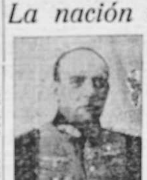
El general von Falkenhayn, jefe de las fuerzas alemanas de tierra, mar y aire en Dinamarca y Noruega, condecorado por el Führer

"Habéis cumplido la enorme tarea que os confié. La nación os expresa su gratitud"