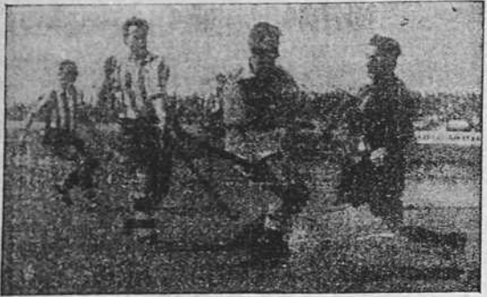
Ruiz, el formidable portero del Athletic, no es capaz de contener el brioso ataque de Enrique Guyatt.