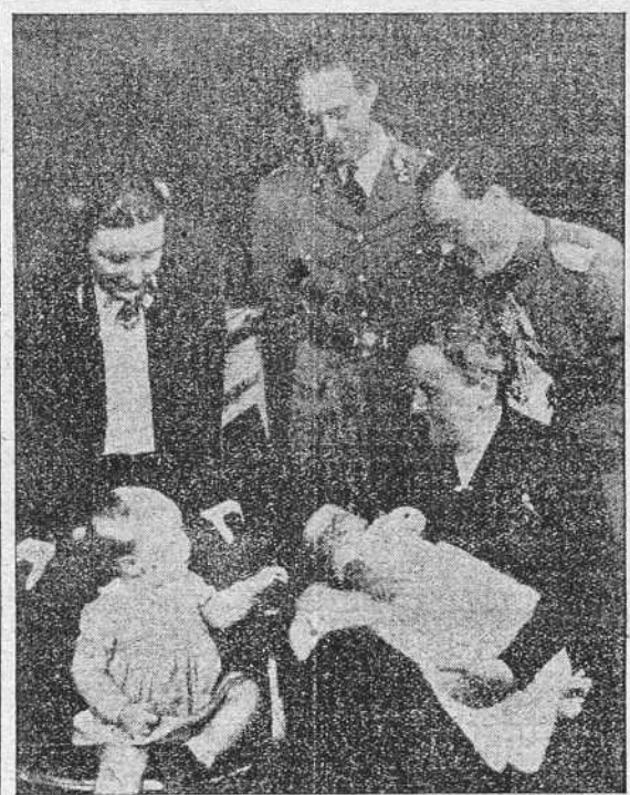
LA INVASION DE HOLANDA.—La reina Guillermina con los Príncipes herederos y las hijas de éstos, y el Rey de Bélgica, padrino de la última princesita holandesa.

LONDRES, 13.—Comunicado del Ministerio del Aire. "Ya es posible dar una versión más detallada de la actividad desarrollada desde la mañana de ayer por la aviación aliada. Después de los reconocimientos realizados por nuestros aparatos, se comprobaron los daños causados en los aeródromos enemigos en Holanda, de los cuales se servían para el desembarco de tropas, sufriendo, además, la pérdida de numerosos aparatos. Por esta razón, el enemigo se ha visto obligado a utilizar terrenos improvisados para el servicio de la aviación. Pese al fuego intenso de las baterías antiaéreas y de los cazas enemigos, nuestros aparatos han destruido dos puentes en Maestricht, desorganizando las comunicaciones de numerosos destacamentos motorizados que operan en estos momentos en Bélgica y Luxemburgo. Las comunicaciones ferroviarias en esta región han quedado interrumpidas y las carreteras destruidas. También han causado importantes daños en las carreteras y vías férreas de Alemania, entre el Rhin y la frontera holandesa, y muy especialmente en los centros de aprovisionamiento. El enemigo ha tenido que aumentar el número de sus patrullas y el de sus fuerzas. Nuestros servicios atacaron a las patrullas enemigas sin que sufrieran grandes pérdidas, pero la aviación enemiga no ha podido impedir que nuestras tropas avanzaran rápidamente en apoyo de sus aliados. La aviación alemana atacó de nue-