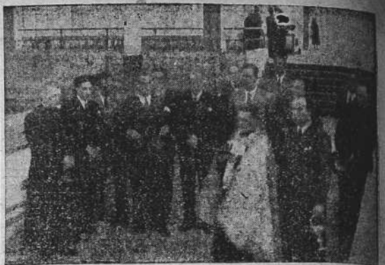
Momento de la bendición del nuevo Mercado de San Agustín que fué inaugurado ayer por la tarde, a las cinco, con asistencia de las autoridades civiles.

Se calcula, termina diciendo la Agencia francesa, que desde el comienzo de las hostilidades en Bélgica, Holanda y Luxemburgo han sido destruidos o dañados los siguientes aparatos alemanes:—(EFE).