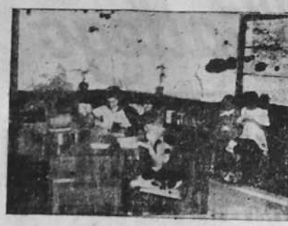
Un aspecto de la Biblioteca Infantil, inaugurada en el Jardín de Méndez Núñez.

En el surtido de ayer resultó presentando el agua 27,2.