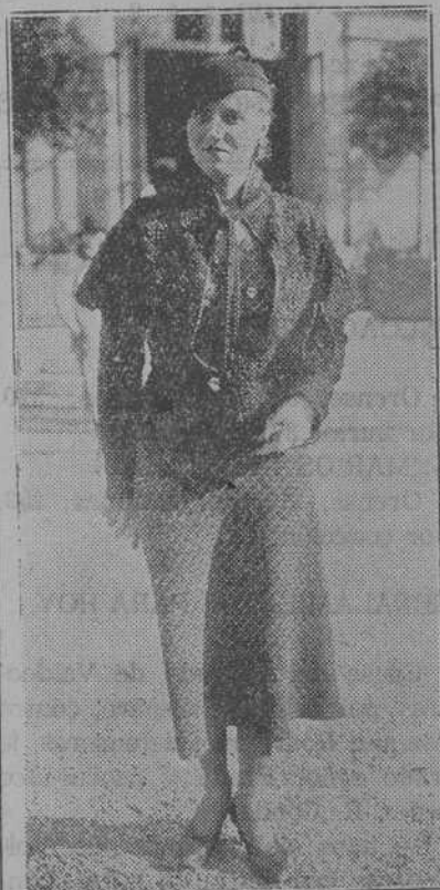
La pequeña chaqueta es el vestido preferido para las elegantes.—He aquí un encantador modelo en est-trakán

Digamos ahora algo acerca de los trajes abrigo, que prestan