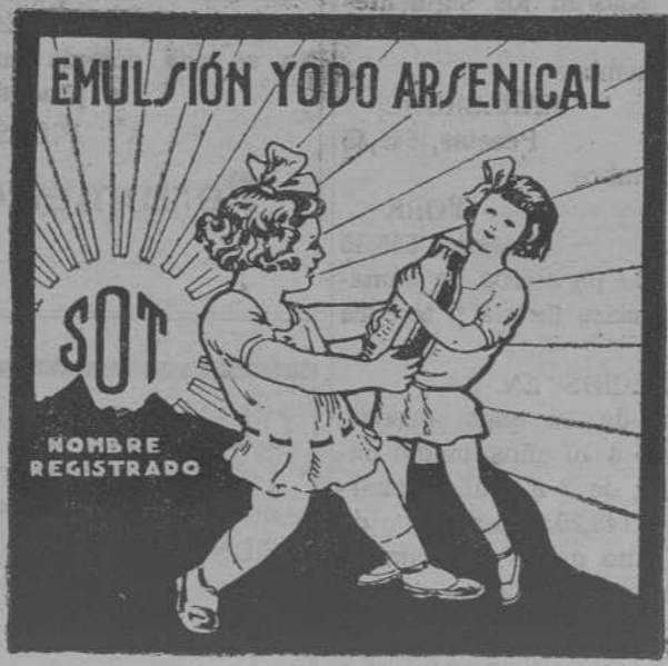
Unica que recomienda la clase médica

TIRANTES - CALCETINES - MEDIAS - CUELLOS Y ARTICULOS DE PIEL