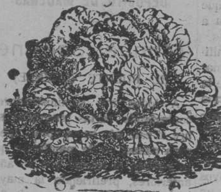
Lechuga de Repollo

Remolachas variadas; guisantes y judías. Tubérculos de flores variadas, gran surtido