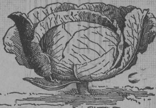
Fig. 9. — Col de Holanda

Remolachas variadas, guisantes y judías. Tubérculos de flores variadas. Gran surtido.