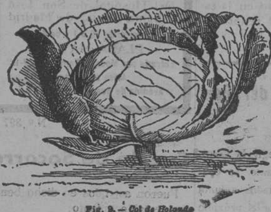
Fig. 9. - Col de Holanda

Remolachas variadas, guisantes y judías. Tubérculos de flores variadas. Gran surtido.