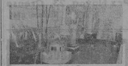
Gabinete de esterilización para la «Gota de Leche»

En suma, el Instituto Provincial de Higiene, es una obra más que honra a nuestra capital y a reali-