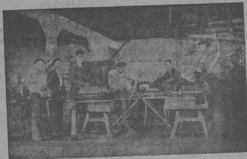
Vista de la Sección de teja plana y curva

Podéis adquirir también mosaicos, bloques, ladrillo, tubería, fregaderas, piletas, peldaños y toda clase de piedras artificiales, a base de inmejorable calidad y precios económicos.