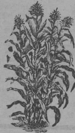
MAIZ.-Producción de 4 a 6 Espigas

Remolachas variadas, guisantes y judías. Tubérculos de flores variadas. Gran surtido.