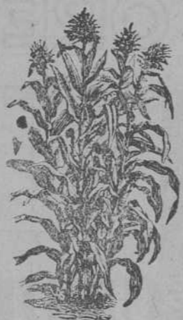
MAIZ.-Producción de 4 a 6 Espigas

Remolachas variadas, guisantes y judías. Tubérculos de flores variadas. Gran surtido.