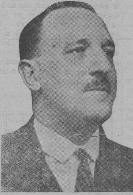
GALICIA da a su distinguido amigo la más cordial bienvenida, deseándole que la estancia entre nosotros, le sea grata.