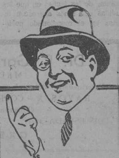
FOTO VILLAR VILLAR FOTO Frente a Correos

Cuide usted su estómago porque es la base de su salud