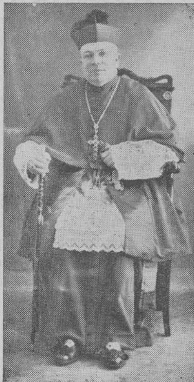
Excmo. Sr. Obispo Auxiliar

En esta ocasión, el Excmo. Sr. Obispo Auxiliar