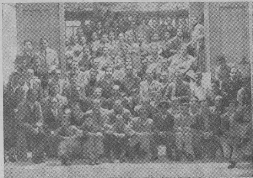
Obreros concurrentes al Centro de las Damas Catequistas de La Coruña que el domingo celebraron una fiesta