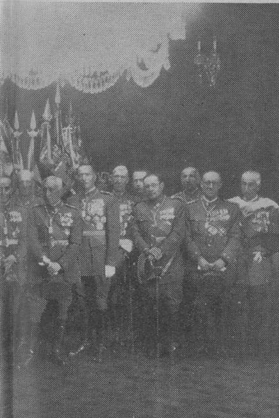
Los Coroneles del Arma de Caballería y el Alcalde de Santiago, momentos antes de salir con los estandartes