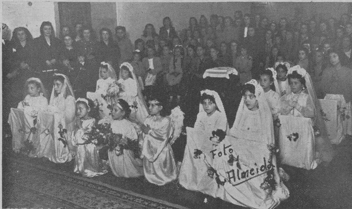
Grupo de niñas de la Escuela Preparatoria del Instituto Femenino de Enseñanza Media "Rosalia Castro" de Santiago, que hicieron su Primera Comunión el día del Corpus en la Capilla del Instituto