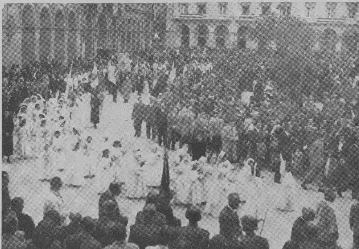
La Coruña: La tradicional y solemne procesión coruñesa del Corpus Christi a supaso por la Plaza María Pita

En Santiago y otros puntos la inseguridad del tiempo impidió la salida de las tradicionales procesiones