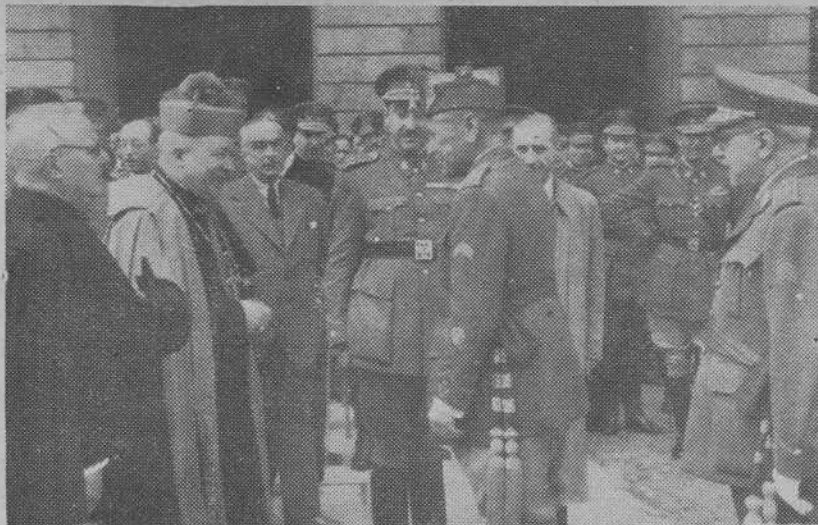
El teniente general Ponte y Manso de Zúñiga es saludado a su llegada al Ayuntamiento por el señor Obispo, el Gobernador Civil, el Alcalde, presidente de la Archicofradía y otras autoridades.