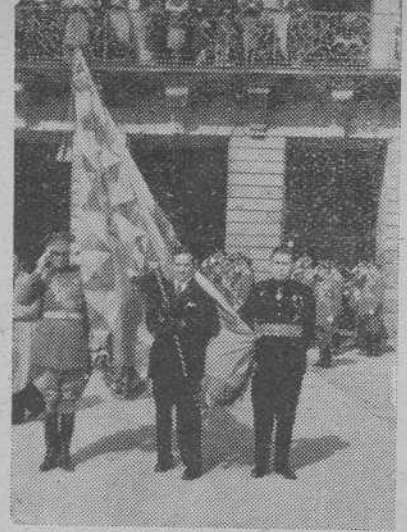
El pendón de la batalla de Clavijo, que figuró en la peregrinación

Esta norma de conducta de los soldados antiguos del Ejército Español, de unir los ideales y servicio de la Religión y de la Patria ha continuado felizmente en la guerra de la Independencia contra los invasores franceses y también en la