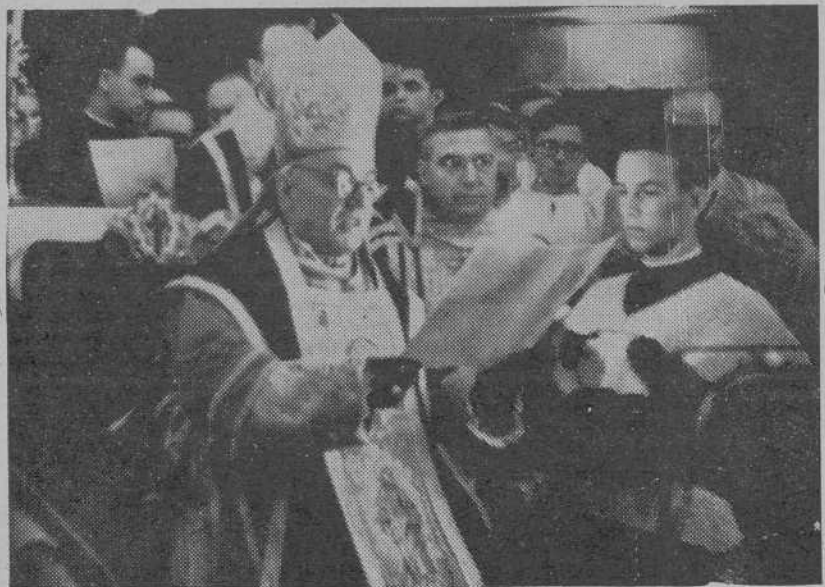
De arriba abajo: Los cuatro ministros y el embajador argentino que asistieron a la ceremonia.—Los prelatos de la Archidiócesis.—El Cardenal Primado contestando al Oferente