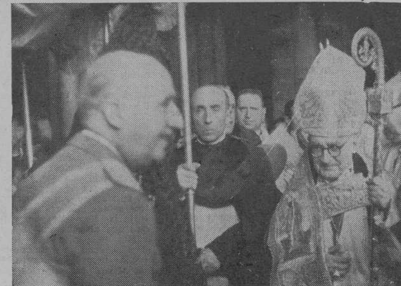
Orden de los grabados, de arriba abajo: El alcalde de Santiago, obsequia a S. E. con una imagen del Apóstol grabada en azabache.—El ministro de Educación presenta a los universitarios peregrinos al Caudillo, que le rindieron homenaje de adhesión y lealtad.—El Jefe del Estado es recibido en el Pórtico de la Gloria por el Primado y el Cabildo catedralicio