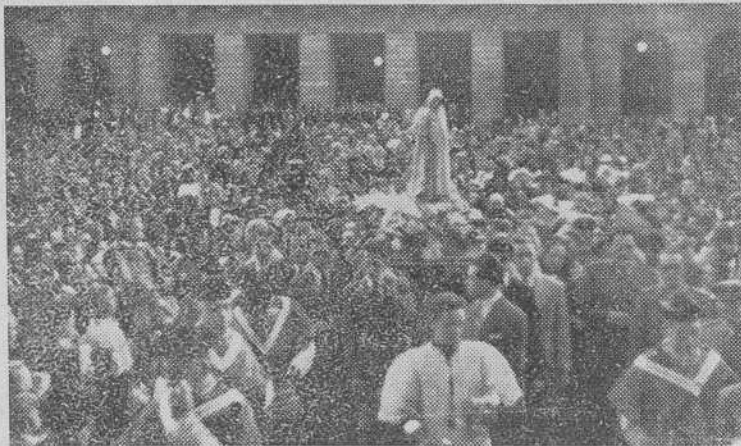
La imagen de la Virgen de Fátima, a su llegada a Santiago, donde se le tributó un fervoroso y conmovedor recibimiento