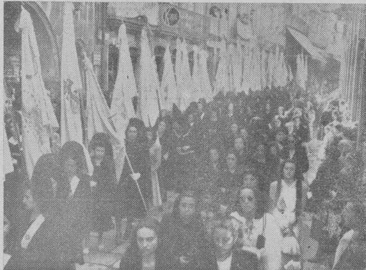
Desfile de la peregrinación de la Juventud Femenina de A. C.

A continuación se organizó el Rosario que, presidido por el Excmo. Sr. Obispo recorrió las calles de la ciudad, portando las peregrinas sendos faroles encendidos. El Rosario se recogió ante el altar de la Sma. Virgen levantado en la plaza de la Quintana, finalizando con la Consagración de las Jóvenes al Inmaculado Corazón y el Juramento del Dogma de la Mediación Uni-