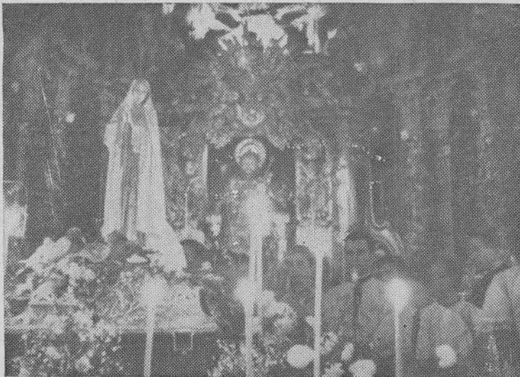
En el presbiterio de la Capilla Mayor, la imagen de la Virgen de Fátima, instalada en altar portátil, recibió el fervoroso homenaje de miles de almas, que desfilaron por la Basílica, sucediéndose los turnos de vela

cesión que constituyó una apoteósica manifestación de fervor mariano del pueblo de Santiago, al que no cesó en todo el recorrido de vitorear y aclamar a la Virgen benditísima. Hízose la entrada en la Catedral, reboante de fieles, por la puerta del Obradoiro, siendo depositada la imagen de Nuestra Señora en un altar portátil colocado en el Altar Mayor de la Basílica.