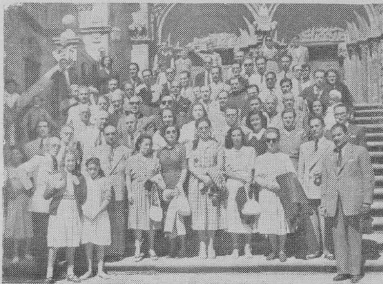
Grupo de periodistas que participan en la VI Asamblea Nacional después de haber ganado el jubileo del Año Santo

Os pedimos, Señor y Patrono nuestro, la unidad y la libertad de la Santa Iglesia; la unidad, la grandeza y la libertad de España