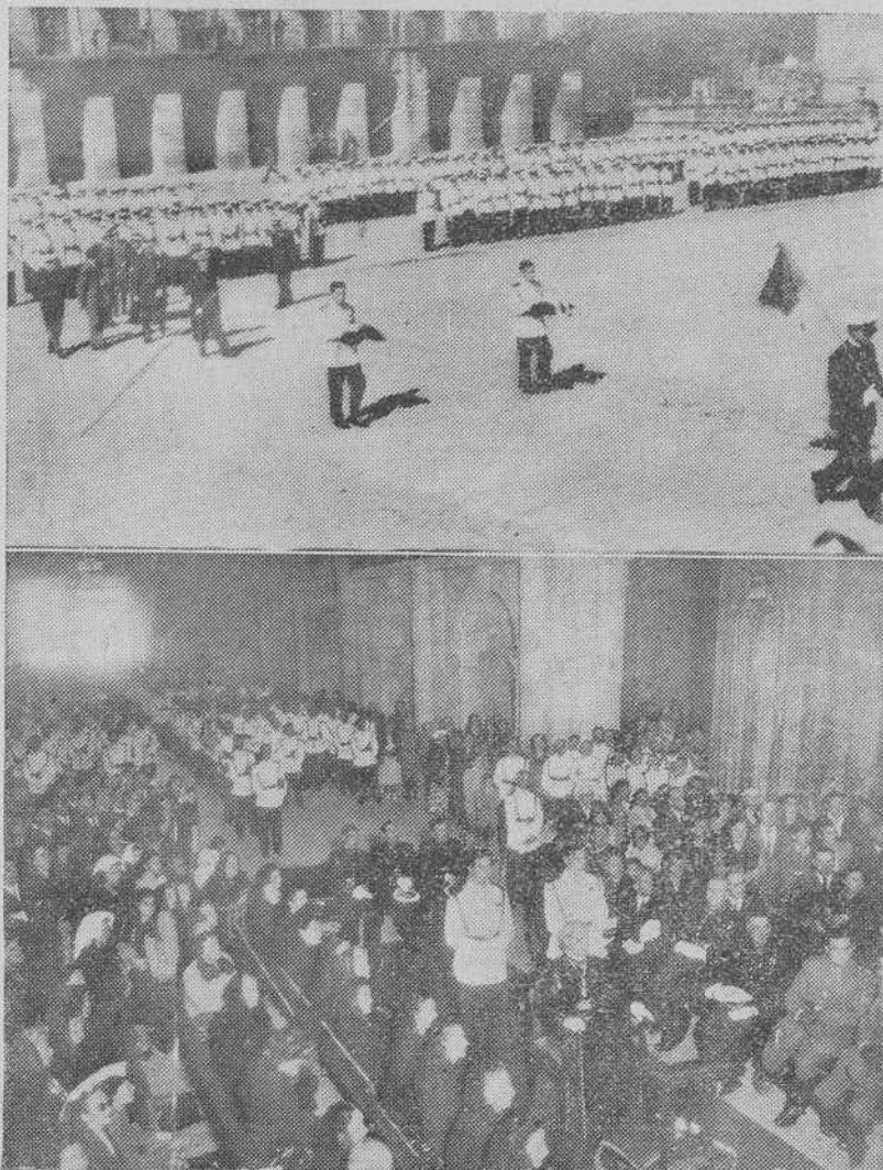
He aquí dos aspectos de la peregrinación de la Infantería de Marina ferrolana, que en el día 14 ganó el Jubileo del Año Santo. El pueblo compostelano tributó a los peregrinos una afectuosa acogida

A partir de la presente fecha todos los pedidos de huchas de cerámica para recoger limosnas para las Misiones deberán hacerse exclusivamente al Secretariado Diocesano de Misiones de Valencia (Iniquete Cabaeros, 5) o al Secretariado Diocesano de esta Diócesis de Santiago (Plaza de la Inmaculada, 4).