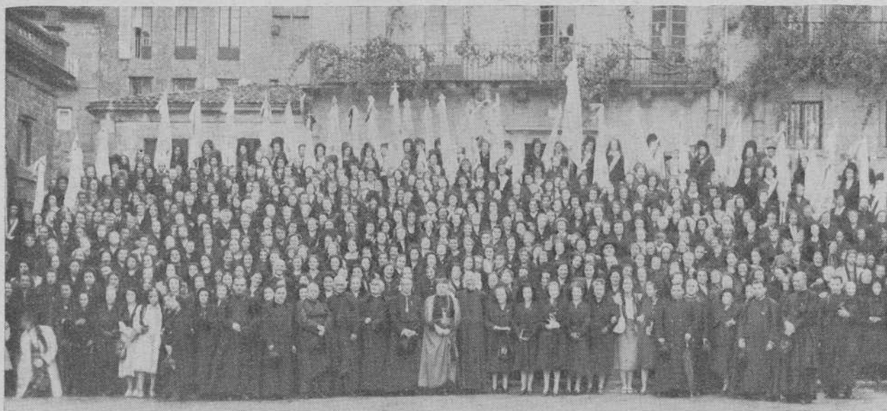
Componentes de la peregrinación nacional de Mujeres de Acción Católica