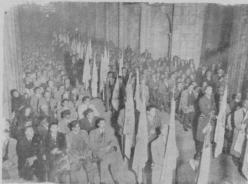
La peregrinación de la Adoración Nocturna en la Catedral compostelana

IV. El Clero indígena ante la Psicología y la Teología.