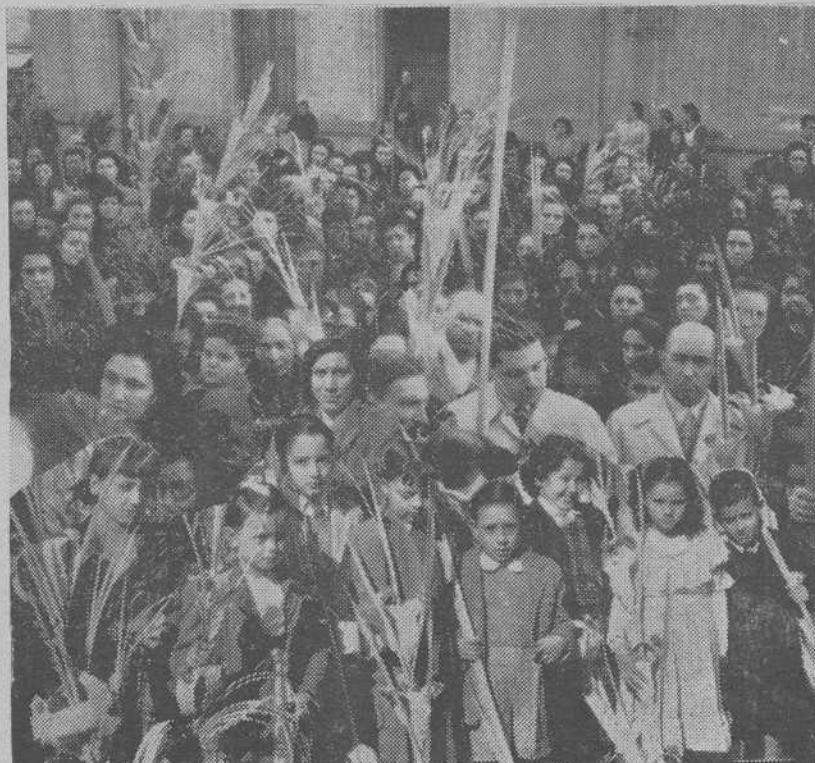
Con numerosa concurrencia de fieles se celebró el Domingo de Ramos, en todas las parroquias, la tradicional y religiosa ceremonia de la bendición de ramos y palmas. A algunas iglesias, como la de Sta. Lucía, fueron muchos los niños que llevaron sus ramos a bendecir

El Excmo. Sr. Obispo bendijo en la Capilla del Palacio Arzobispal