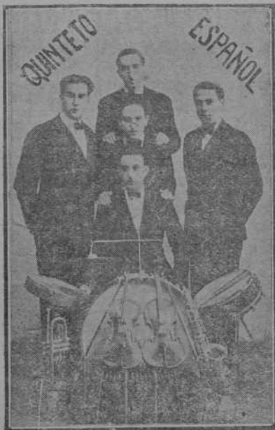
El notabilísimo QUINTETO ESPAÑOL , que hoy hará su debut y amenizará los bailes que en estos días se celebran, en la Liga de Amigos.

Encargue V. sus trabajos en la imprenta La Voz del Agro