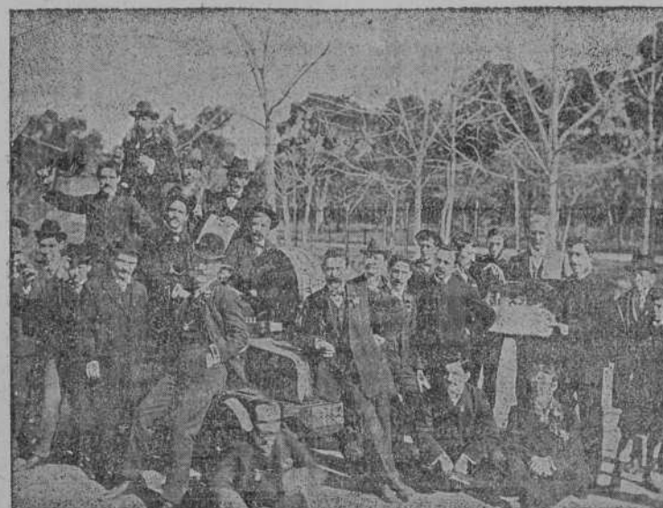
Apunte de la romería mindoniense

«formando época» en la historia de los pueblos sin grandes esfuerzos y sacrificios y sin perseverancia en el bien, todos debemos celebrar que Mondoñedo haya obtenido la señaladísima victoria de figurar con personalidad saliente y propia (que no tiene en España sino en los papeles del Estado) en un centro tan importantísimo como Buenos Aires.