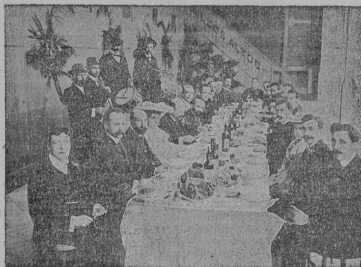
Banquete de la Comisión de la romería mindoniense

Hoy no se le oculta á ningún argentino que los emigrantes de la ciudad de Mondoñedo son elementos de cultura, de actividad fecunda y de trabajo que dignifica y ennoblece; pero como esas cualidades, por solo ser buenas no se dan á conocer,