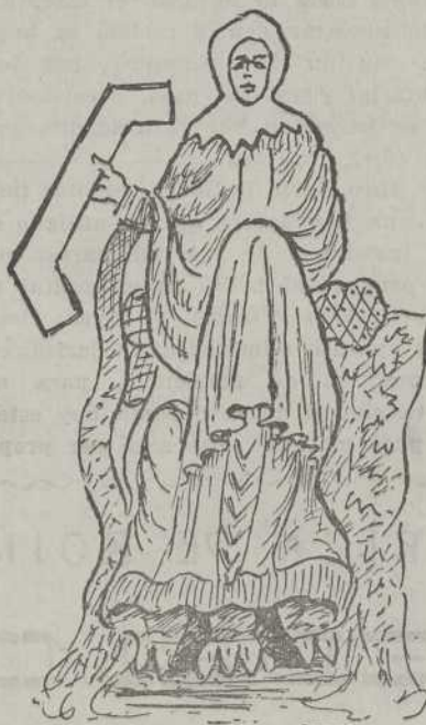
La Infanta D.ª Urraca, hija de Fernando I, por cuya iniciativa y donaciones se reconstruyó la ciudad en 1.071. Miniatura del Tombo A de la Catedral de Santiago.