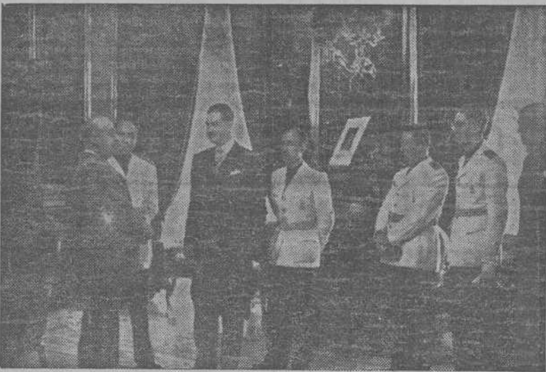
Una comisión de Lérida, formada por el Gobernador civil, Alcalde y Concejales, hace entrega de la Medalla de Oro de la ciudad a S. E. el Jefe del Estado. (Foto CIFRA).