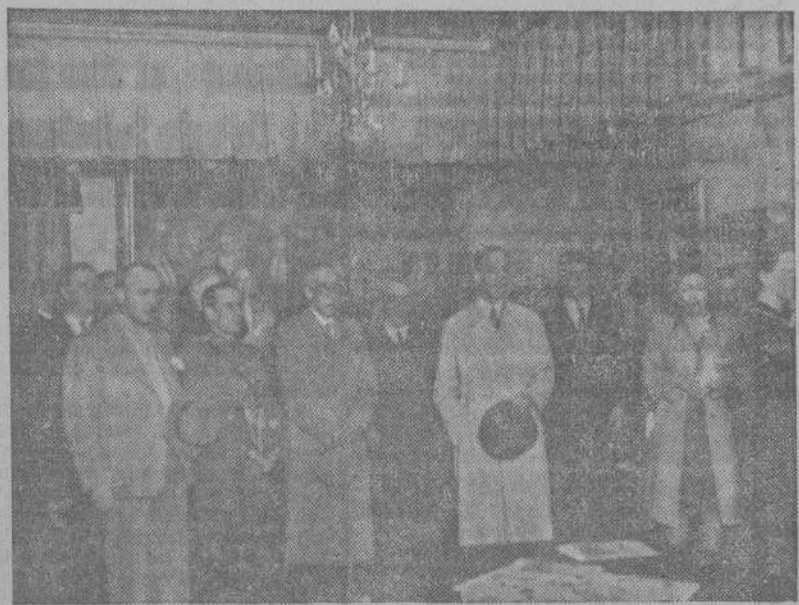
Las autoridades en el acto inaugural de la exposición de Vázquez Díaz, organizada por la Delegación de Educación Popular