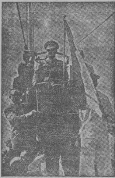
S. E. el Jefe del Estado, con los Ministros de Marina y Agricultura y otras personalidades, rinde homenaje desde la torreta de un submarino de la Armada española a los caídos del "Castillo de Olite", en aguas de Cartagena. (F. CIFRA).