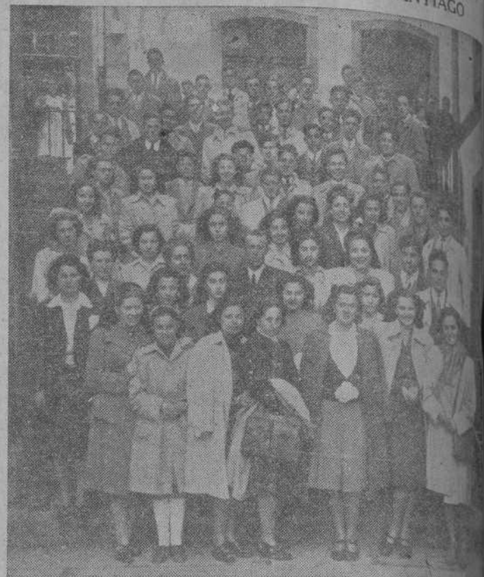
SANTIAGO.—Los alumnos de la Academia Galicia, de La Coruña, en la excursión que hicieron a Santiago.