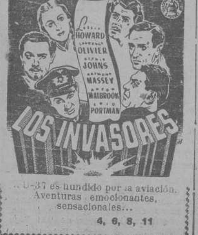
Los Invasores. Aventura emocionante, sensacional...