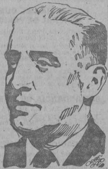
Don Juan Antonio Ríos, Presidente electo de Chile que ha fallecido

SANTIAGO DE CHILE 27.—El presidente de Chile, don Juan Antonio Ríos, ha fallecido.