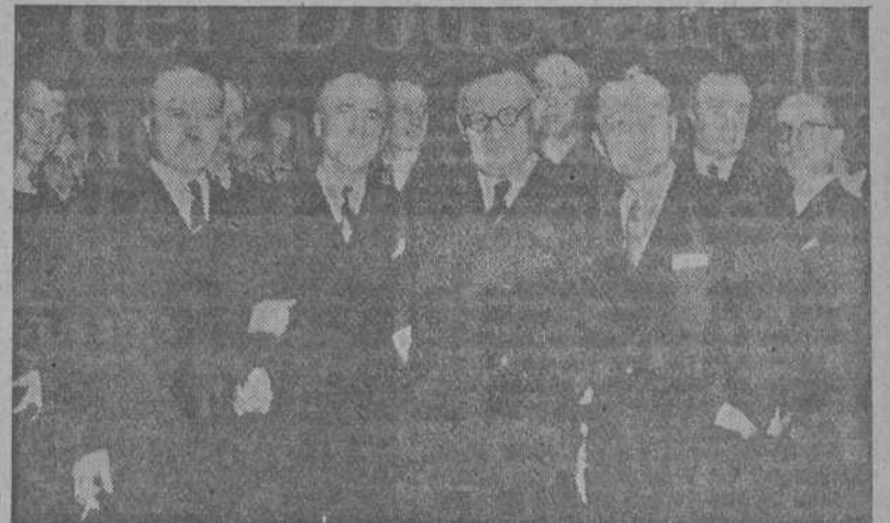
Los cuatro ministros de Negocios Extranjeros—Molotov, Byrnes, Bevin y Bidault—que ayer llegaron a rápidos y sorprendentes acuerdos sobre importantes problemas

La comisión decidió igualmente recomendar que los cuatro grandes traten de hallar una fórmula de acuerdo permanente, en defecto de lo cual el asunto habría de pasar al Consejo de Fideicomisos de la ONU, una vez que funcione éste.—(EFE).