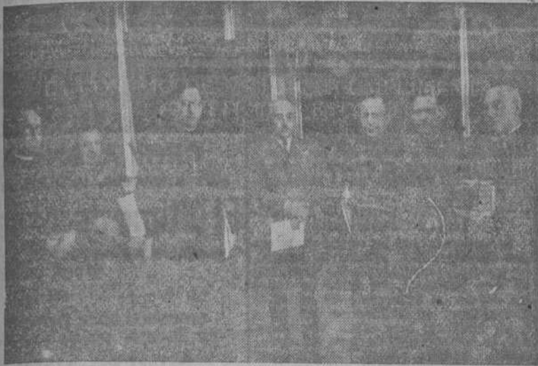
S. E. el Jefe del Estado ha recibido en audiencia a la Comisión Permanente del Consejo Supremo de Misiones, presidida por el Padre Legisima, que le ofreció sus respetos en nombre de todas las Ordenes Religiosas Misioneras.

EL CONSEJO DE MISIONES CUMPLIMENTA AL JEFE DEL ESTADO