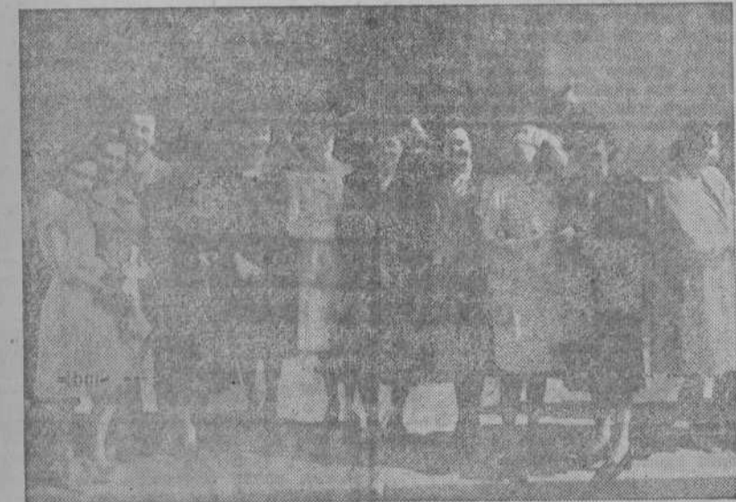
Damas y enfermeras de la Cruz Roja Española que concurren a la misa organizada por el Cuerpo de Sanidad el día de su Patrona, la Virgen del Perpetuo Socorro