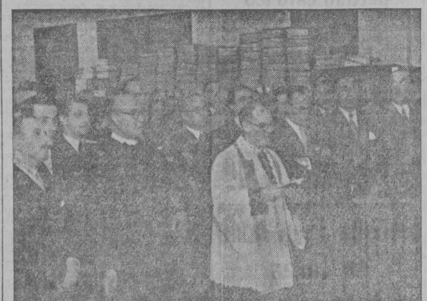
Bendición y entronización de la Virgen del Perpetuo Socorro, en la Delegación del Instituto Nacional de Previsión de La Coruña

El Instituto Nacional de Previsión celebró ayer una gran fiesta con motivo de la entronización de la Santísima Virgen del Perpetuo Socorro en sus oficinas.