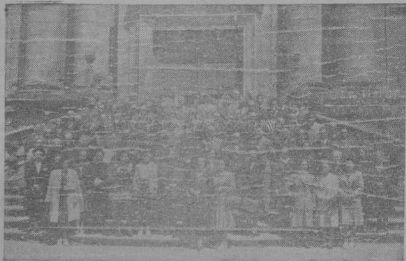
SANTIAGO.—Asistentes de toda Galicia al Cursillo de Caridad que se celebra estos días en el Seminario organizado por Acción Católica