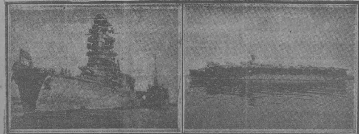
El acorazado japonés, de 32.720 toneladas, "Nagato", uno de los blancos establecidos para la bomba atómica en Bikini. En la segunda foto, el portaaviones norteamericano, de 11.000 toneladas, construido en 1942, "Independence", que sufrió el impacto directo de la bomba.