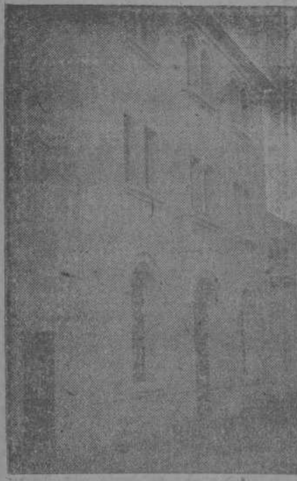
Un aspecto de la nueva Capilla de los PP. Capuchinos, abierta ayer al culto. — Momento de ser trasladado procesionalmente el Santísimo desde la antigua Capilla a la recientemente construida.

Con gran solemnidad se efectuó ayer el traslado del Santísimo de la capilla, donde estuvieron instalados los Padres Capuchinos desde que la horda destruyó con un incendio la primitiva Residencia de dicha benemérita Comunidad, a la nueva, erigida en el mismo lugar del desastre, merced a la caridad y fervor de los fieles.