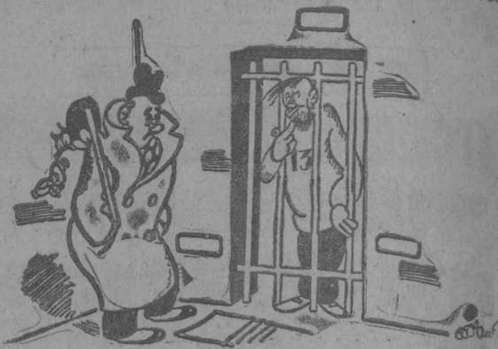
NOTA, por Miranda —Te encuentro muy afectado. —¿"Afectado" con esta barba?