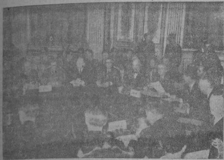
Fotografía de la mesa redonda del Palacio del Luxemburgo donde "los cuatro" han celebrado las reuniones que terminaron ayer, sin grandes resultados