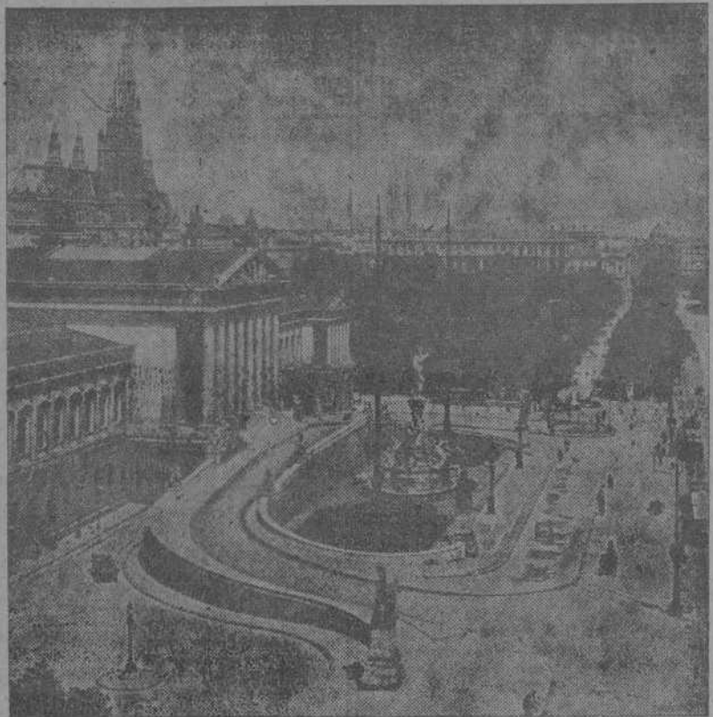
UNA VISTA DE VIENA, LA BELLA CAPITAL DE AUSTRIA