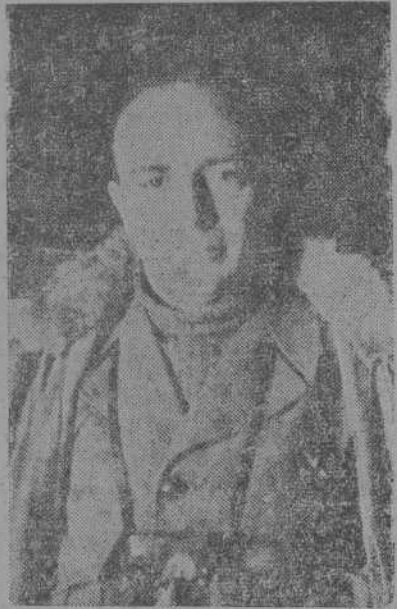
El teniente general D. Pablo Martín Alonso

En la Subsecretaría de Educación Popular se facilitó anoche la siguiente referencia de lo tratado en el Consejo de Ministros celebrado bajo la presidencia de S. E. el Jefe del Estado: PRESIDENCIA.—Decreto por el que se establece el régimen de dependencia de las posesiones españolas del África occidental. Decreto por el que se disuelve la Comisión de reivindicación de bienes en el extranjero. Decreto por el que se encomienda al Instituto Nacional de Industria la creación de una empresa mixta con la misión fundamental de ejecutar el plan de aprovechamiento hidroeléctrico integral del río Noguera Ribagorçana y sus afluentes. Expedientes de trámite. ASUNTOS EXTERIORES.—Acuerdo sobre exención de los recargos a que se refiere el artículo primero del Decreto de 15 de abril último en favor de los miembros del Cuerpo Diplomático extranjero acreditado en España. GOBERNACION.—Decreto por el que se regula la norma para aumento de precios unitarios de obras ejecutadas por el Ministerio de la Gobernación con posterioridad al primero de abril de 1946 mediante el procedimiento de subasta o concurso. Decreto por el que se concede sepultura perpetua a los caídos por Dios y por España, víctimas del terror marxista. Decretos por los que se determinan las subvenciones para reconstrucción de templos parroquiales por un importe de un millón, cincuenta y cinco mil pesetas. EJERCITO.—Decreto por el que se nombra jefe de la Casa Militar de Su