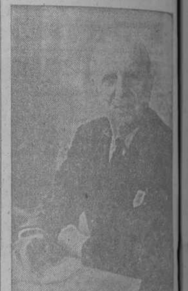
Lord Woolton, que ha sido nombrado presidente del partido conservador inglés.