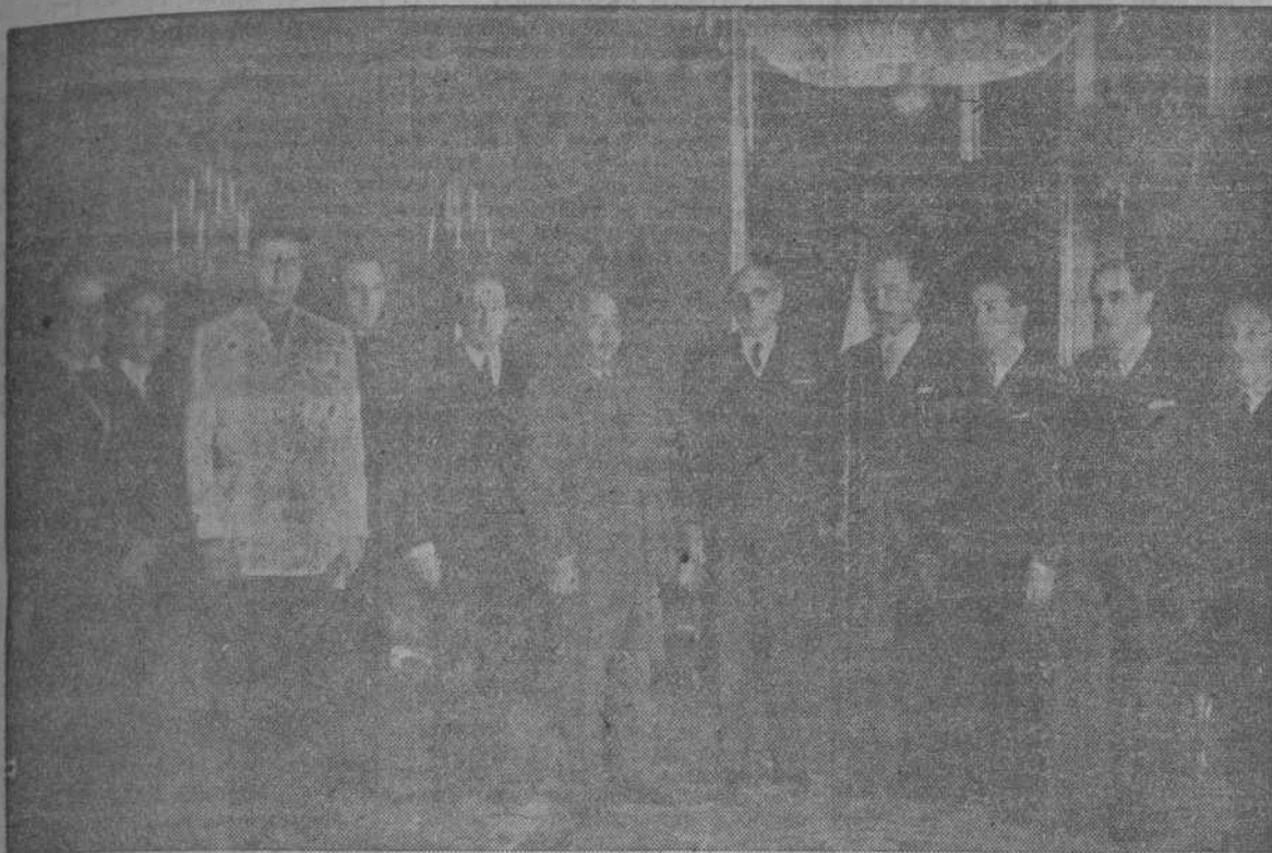
E. E. el jefe del Estado recibe en el Palacio de El Pardo a los miembros del Consejo General de Colegios Oficiales Farmacéuticos de España, que acudieron a presentarle sus respetos y adhesión incondicional.

LOS COLEGIOS FARMACEUTICOS CUMPLIMENTAN AL CAUDILLO