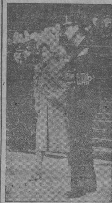
Los Reyes de Inglaterra a la salida de la misa celebrada en la Catedral de San Pablo, para pedir por el buen éxito de las Naciones Unidas

La reunión terminó a las nueve de la noche. Mañana volverán a reunirse.