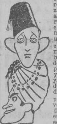
Bing Crosby y Bob Hope

De la película, si se exceptúa la bella escena final, en que la bien timbrada voz de Bing Crosby se exterioriza en patrióticos tonos, cabría afirmar que no paso del sentido alegre y des-