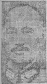
Chang Kai Chek

NANKIN, 8.—El Generalísimo Chang Kai Chek ha dado la orden de la suspensión de hostilidades en la guerra de China por parte de las tropas gubernamentales, excepto en los casos en que sea necesario defender las actuales posiciones en la propia China y en Manchuria.