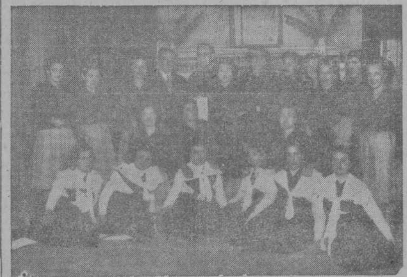
Grupo de divulgadoras rurales que asistieron al cursillo celebrado en el Grajal, con las jerriquías en el acto de clausura