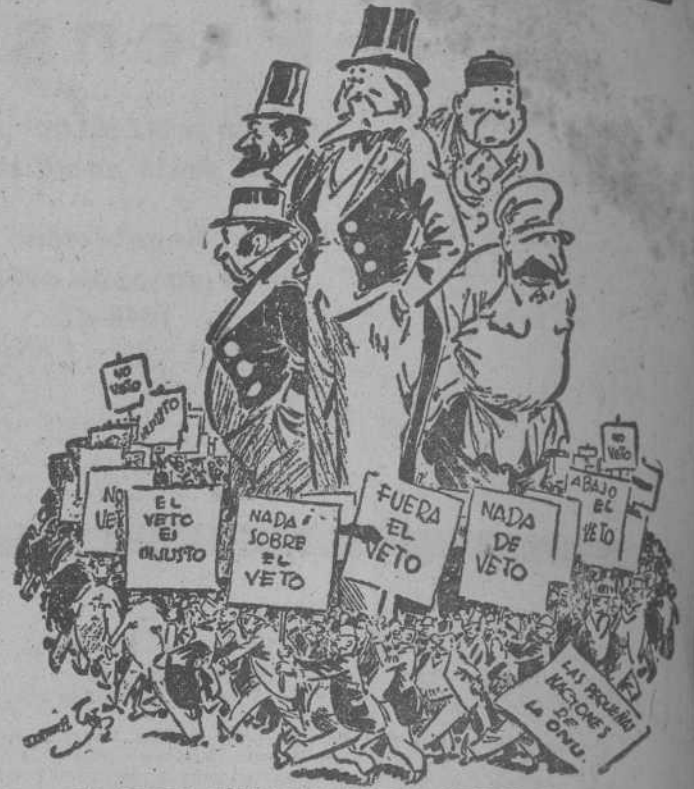
EN OTRAS PALABRAS, ESTAN CONTRA EL VETO