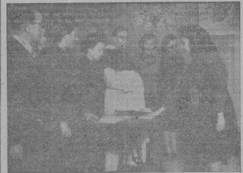
Una camarada de Falange prestando el juramento en el acto de clausura del curso de Mandos menores

MADRID 29.—El pintor Vázquez Díaz dentro de su gravedad, ha experimentado una notable mejoría. Se halla hospitalizado en un Sanatorio y sufrirá una intervención quirúrgica en cuanto los médicos consideren oportuna su realización.—(EFE).