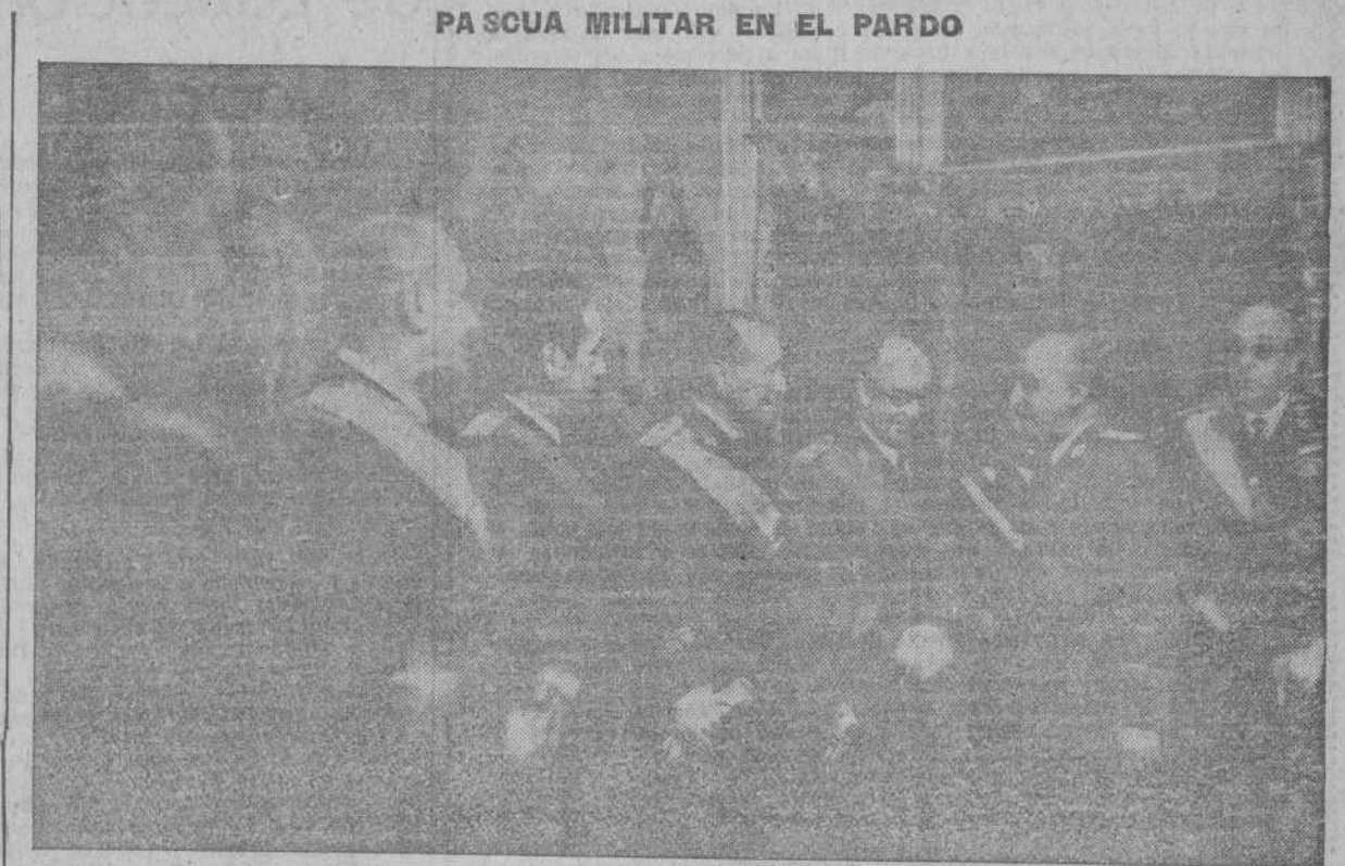
S. E. El Jefe del Estado recibió en el Palacio de El Pardo a los Altos Jefes Militares de la Guarnición de Madrid que le expresaron la adhesión del Ejército