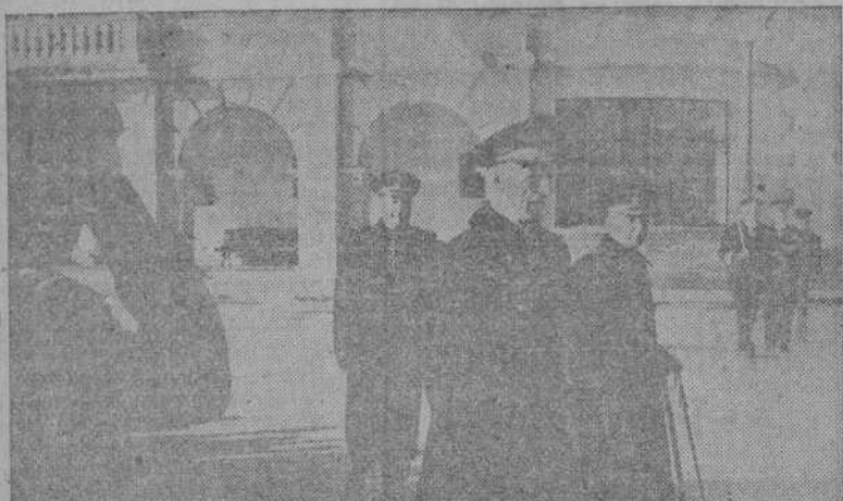
El Capitán General del Departamento, Almirante Morey, a su llegada a la Escuela Naval, para presidir los actos celebrados con motivo de descubrir una lápida en honor del Almirante don Francisco Moreno Fernández