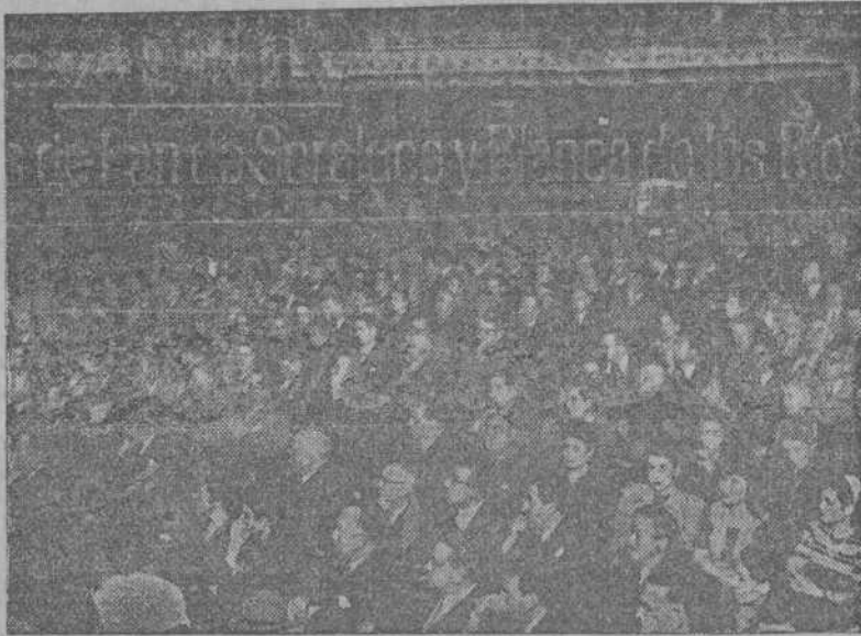
Aspecto que ofrecía el patio de butacas del Teatro Rosalía de Castro durante la velada homenaje a la Condesa de Pardo Bazán

Con frases de verdadera elocuencia analiza el señor Calvo Sotelo el origen de aquellos constantes trasiegos de la