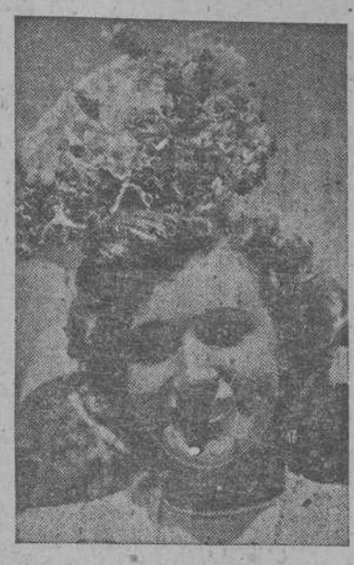
Sombrero adornado con rosas y otras flores en la última novedad primaveral en Londres

Terminado el mes de marzo, hay que pensar en vestirse de Primavera. ¡Qué alegría sentimos de poder salir a la calle con prendas más ligeras y no necesitar en unos meses ir envueltas en pieles como los esquimales! Y no sé por qué, pero lo cierto es que cada vez que hay un cambio de estación, aunque conservemos algún abrigo o traje que podamos todavía usar, jamás podemos resistir la tentación de hacernos algo nuevo, que lleve el signo de las modas más recientes. Caprichos no censurables, ni son personas de posición desahogadas quienes los realizan, y cuyo principal fin sea facilitar así trabajo a los obreros; las Industrias y todos los que viven de las modas tendrán que agradecerlo.