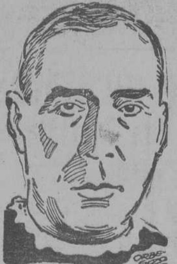
DON DOMINGO PEREZ CACERES Obispo de Tenerife