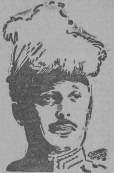
GENERALISIMO DON RAFAEL LEONIDES TRUJILLO Presidente de la República Dominicana