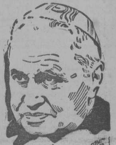
CARDENAL MANUEL CELESTINO SUHARD