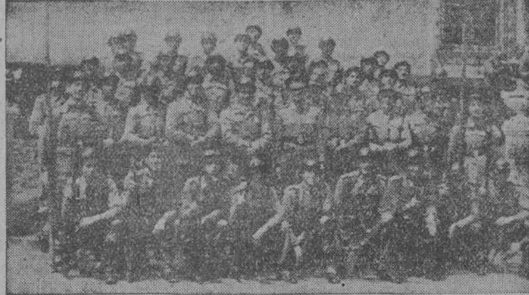
Patrulla del Regimiento Infantería de Isabel la Católica número 29 que se clasificó campeón en las pruebas de Gimnasia educativa y aplicación militar