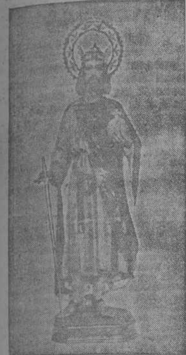
San Fernando, Rey de España

Celebran hoy las juventudes españolas el día de su Patrón, San Fernando; el Rey que se hizo a manos de sus virtudes nueva genealogía en el cielo, olvidando los apellidos reales y