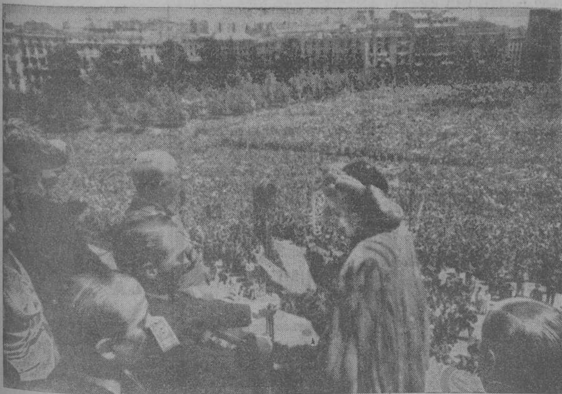
La esposa del Presidente argentino, doña María Eva Duarte de Perón, con Su Excelencia el Jefe del Estado, en el salón del Palacio de Oriente, desde el cual recibió la clamorosa y entusiasta adhesión del pueblo de Madrid

ATLANTIC CITY, 10.—Los médicos que asisten al Congreso que se celebra en esta ciudad con motivo del centenario de la Federación de médicos americanos, esperan encontrar definitivamente el tratamiento que ponga fin a las úlceras de estómago. En el Hospital de Nevark se han realizado experimentos en estos meses pasados con gran éxito. Se trata de curar úlceras de estómago con resina sintética. De los sesenta pacientes sometidos a ese tratamiento, 46 sanaron. —(EFE).