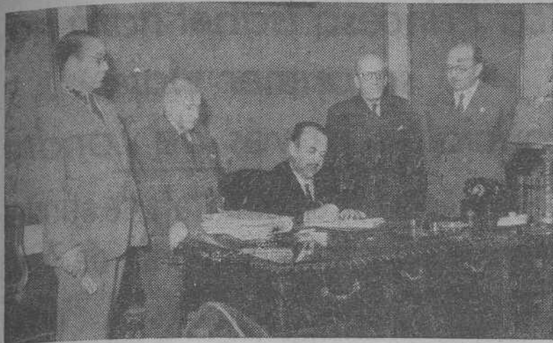
MADRID.—Momento de la firma, en el Banco de Crédito Local de España, de una operación de crédito con el Ayuntamiento de La Coruña, por un importe de dieciséis millones trescientas mil pesetas, que se destinarán para la construcción de Hospitales, Clínicas, etc.