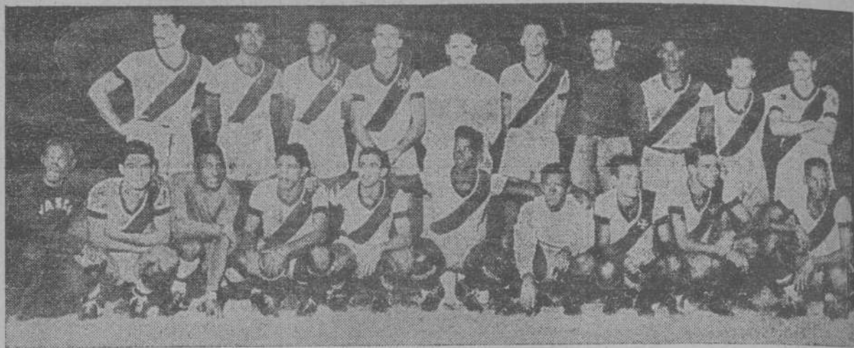
EL "VASCO DE GAMA", CAMPEON DE L BRASIL

—Pues en La Coruña van a ser muy agasajados.