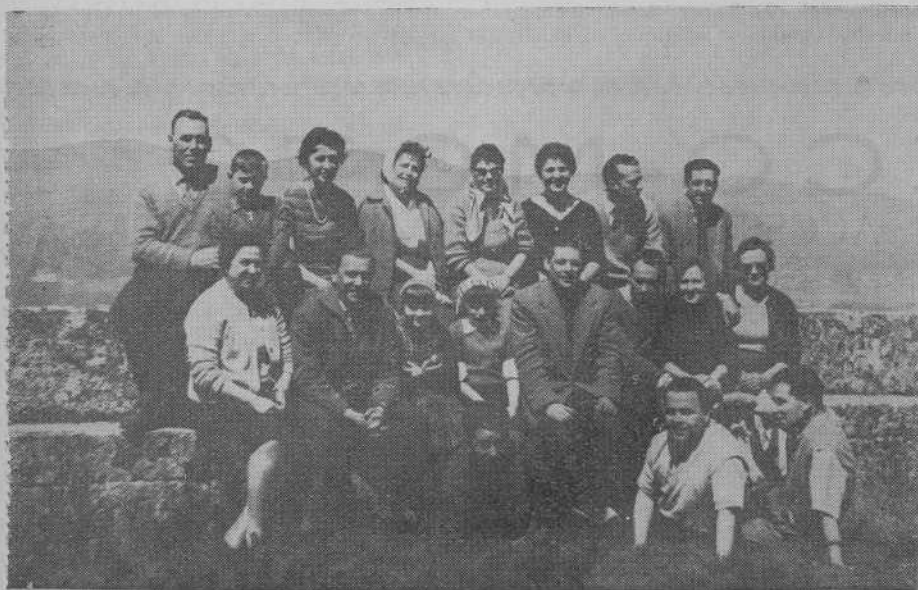
Grupo de participantes en la excursión de La Peneda

Después de admirar las antedichas alfombras y presenciar el paso de la solemne procesión, nos trasladamos a Mondariz para efectuar la "sublime" operación de comer, al final de la cual nos trasladamos al Balneario donde celebramos un interesante encuentro futbolístico (con balón de estreno) contra la So-