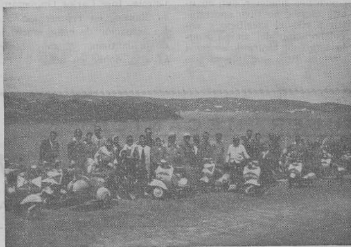
Participantes en la jira inter-galaica momentos antes de efectuar la entrada en El Ferrol

La mañana siguiente, día 29, la dedicamos a recorrer la ciudad, aun cuando para ello hubiéramos necesitado más tiempo, y tras recoger nuestras máquinas en el garage del Servicio Vespa, gentilmente puesto a nuestra disposición, iniciamos la partida a las once de la mañana, sintiendo en nuestro interior que algo nos dejábamos en la ciudad hermana, algo muy hondo y afectivo; dejábamos unas amistades sinceras, unas amistades que perdurarán en nuestros corazones agradecidos de vespistas y de vigueses, de gallegos. A todos estos amigos del Vespa Club de El Ferrol, y en ellos a todo el pueblo ferrolano, nuestras más expresivas gracias y nuestro más entrañable saludo.