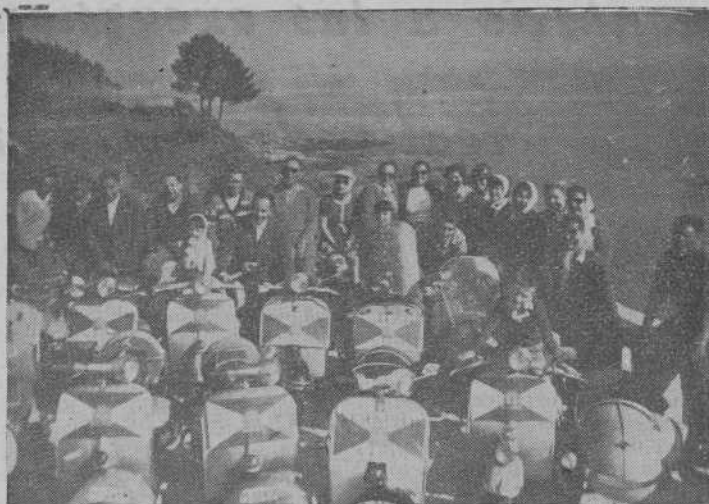
Excursión a Marín y Río Lerez

Con buen número de participantes y un tiempo magnífico celebramos esta ex-