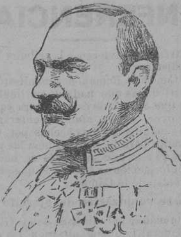
El general alemán von Molke, fallecido a consecuencia de un ataque de apoplejía durante los funerales del general von der Goltz.