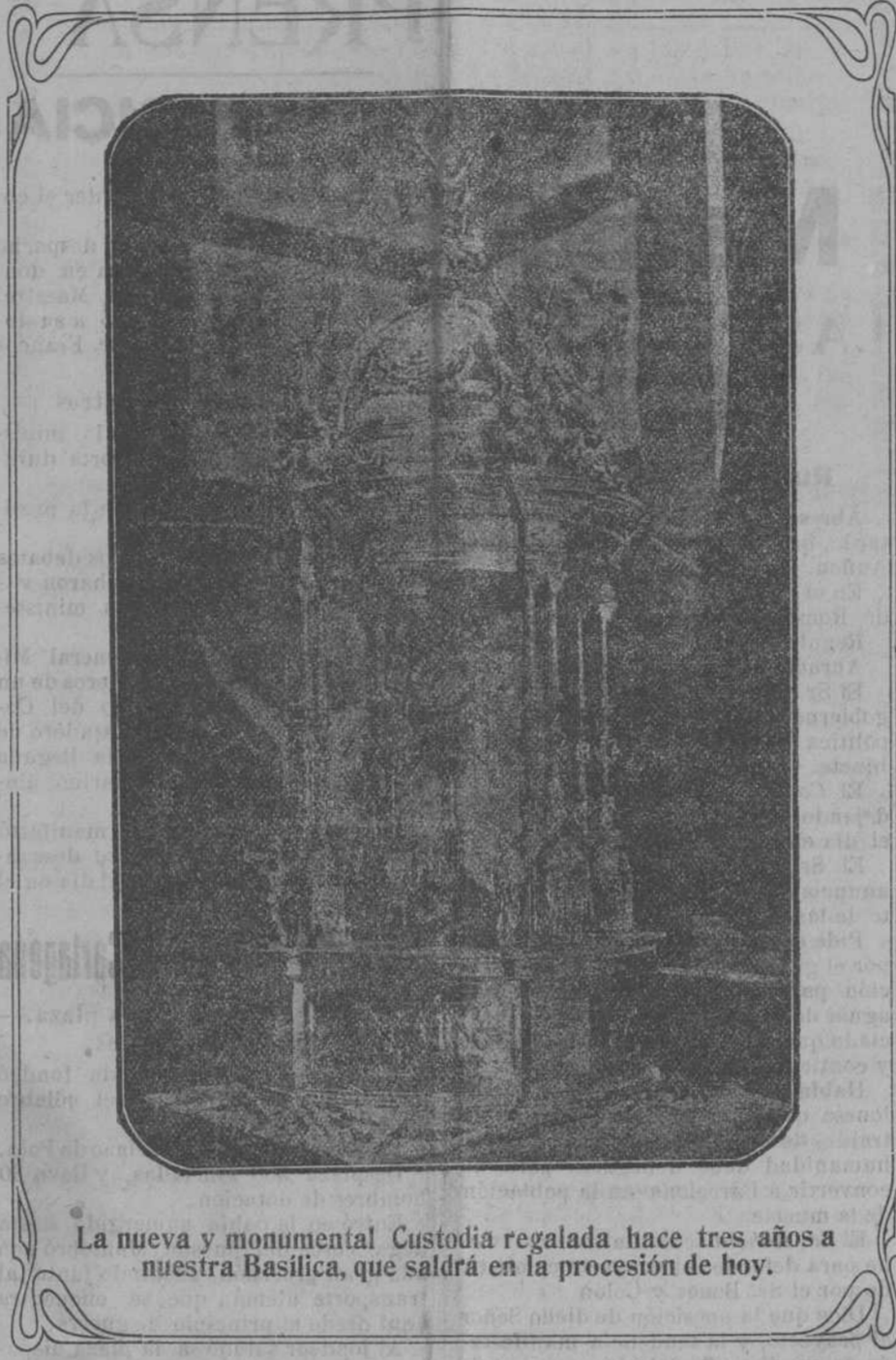
La nueva y monumental Custodia regalada hace tres años a nuestra Basílica, que saldrá en la procesión de hoy.

La misma nota oficiosa rusa, de que queda hecha mención, dice que las operaciones de Baranovich no tienen importancia, pues solo se trató de un reconocimiento. ¿No tienen importancia? Dicen ellos que