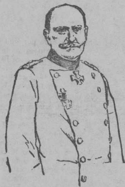
El general Beseler, gobernador de Polonia, que en nombre de los imperios centrales proclamó en Varsovia la independencia polaca.

Los emperadores de Alemania y Austria han cumplido la palabra que empeñaron al principio de la guerra. Un decreto dictado conjuntamente por ambos soberanos, restablece el antiguo reino de Polonia con corona hereditaria y Gobierno constitucional. Este acto de los Imperios Centrales, realizado en medio del fragor de los combates en que los pueblos de Europa ventilan el pleito de la supremacía imperialista en el mundo, es altamente significativo. Ciertamente, desde el punto de vista de los derechos humanos abstractos de los polacos, Alemania y Austria no hacen más que reparar aquel brutal despedazamiento que puso fin a la vida atormentada del reino de Polonia. Pero es preciso reconocer que la historia no ofrece ejemplos repetidos de reparaciones de este linaje. El tiempo suele borrar el ansia de libertad en los subyugados. Esta vez, sin embargo, los sucesos han llevado las aguas por otros cauces; y es la guerra, instrumento ordinario de la opresión, la que viene a romper las cadenas que ataban a los polacos al carro germánico. El decreto de los emperadores deja sin fijar los límites del reino renaciente. No es dudoso que,