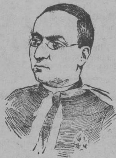
El Cardenal Della Volpe

En este mes el tiempo es lluvioso y poco apacible, especialmente en la segunda quincena, durante la cual los frios se dejan sentir intensamente. Deben tenerse encerrados los cerdos para la ceba en las cochiqueras proporcionándoles abundante y succulenta nutrición. En las viñas deben descalzarse las cepas operación que consiste en destruir las raicillas superficiales y airear el subsuelo en derredor del tronco. Se recomienda una limpieza general de los gallineros y palomares procediendo al abrigo de los mismos. En los jardines se podan los rosales y se siembran céspedes de todas clases para la formación de tapices duraderos. Se siembran los centenos, el trigo, la cebada y la avena. Días antes de la sementera del trigo debe de mezclarse con un poco de cal viva en polvo para obtener de la recolección todo el grano inmejorable. También se siembran las legumbres de invierno en esta época. Es conveniente abonar los prados y estercolar las esparragueras.