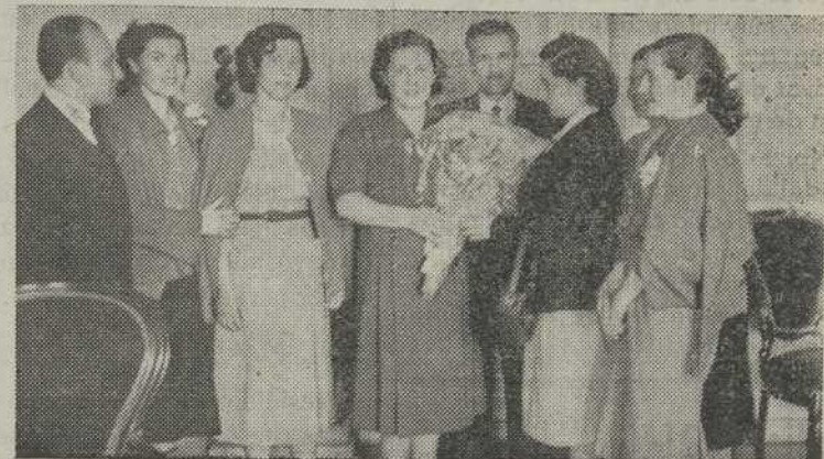
Ofrenda de flores a la esposa del Gobernador civil

Al terminar esta simpática reunión, una comisión de los agremiados, se trasladó al Gobierno Civil, para ofrendar a la señora del Gobernador un hermoso ramo de claveles. Igual ofrenda le fué hecha a la esposa del alcalde de esta capital.